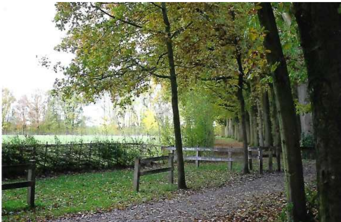
Figuur 2 Het Hemmense bos

Stroomruggen zijn natuurlijke verhogingen in het landschap, de oeverwallen langs voormalige rivierlopen veroorzaakt door vroegere overstromingen. Bij overstromingen wordt het zwaardere zand langs de rivier afgezet en vormt oeverwallen. De lichtere kleideeltjes bezinken verder van de rivier, en vormen de komkleigebieden. Voor 1300 stroomden de rivieren vrij de Betuwe in. Na 1300 werden er dijken aangelegd. Op de oorspronkelijke oeverwallen ontstond bewoning. Het dorp Hemmen is ontstaan op een oeverwal. De beste tijd om het gebied te bezoeken is het voorjaar (vogels, bloemen) en het najaar (paddenstoelen).