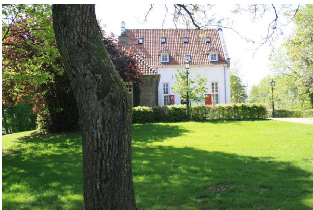
Huis te Lathum

Toen Thijsse hier kwam stond dit huis er al lang. De eerste vermelding dateert uit de 12 e eeuw. Het behoorde vroeger toe aan een landgoed met dezelfde naam. Maarten van Rossum (1478 - 1555), krijgsoverste van Karel van Gelre en later van Willem van Gulik, zou hier in de kelder gevangen hebben gezeten. Wat later, in 1672 ontving Lodewijk XIV hier de Arnhemse gedeputeerden die over de overgave van de stad kwamen onderhandelen.