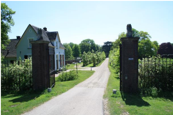
Entree van landgoed Bingerden langs de N338

Tegenover het gemeentehuis ligt buitendijks achter een mooie oude Tamme kastanje op een klein terpje de oude boerderij 'Kroonestein'. Aan de oostkant van deze boerderij werden in het verleden arbeiders met roeibootjes overgezet naar de steenfabriek 'Bingerden' aan de overkant van de IJssel.