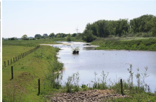
Oude rivierarm buiten Rheden