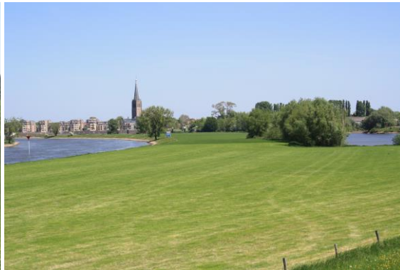
De IJssel met zicht op Doesburg

Doesburg is een heel mooi oud stadje met vestingwallen, mooie huizen en een fraai kerkplein. Het is zeker de moeite waard door deze stad wat rond te lopen en van het moois te genieten. Uit een plaatje in het Verkade-album blijkt dat Doesburg in Thijssse's tijd, net als Arnhem, een houten schipbrug had. Een tussenstuk werd er steeds uitgevaren als een schip moest passeren. Nu is er een vaste brug waar veel verkeer over gaat.