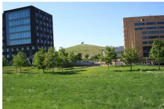
Het Rijnhert bij IJsseloord II er komen hier zonnepanelen

Rechts van het fietspad staat een wit huis, boerderij de 'Steenwaard', het oude veerhuis van het opgeheven Lathumse veer. Links van de weg zie je een ooievaarsnest.