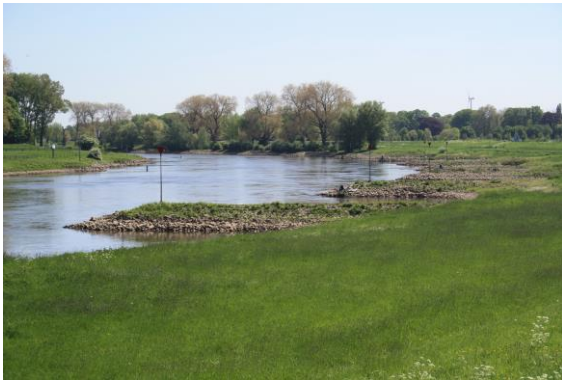
De IJssel voorbij Giesbeek