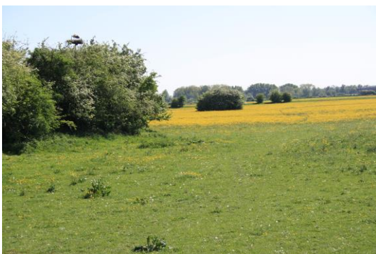
De ooievaars nabij het oude Veerhuis