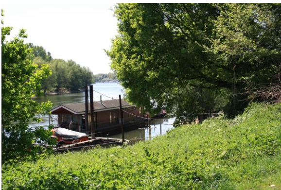
Oude rivierarm bij De Steeg