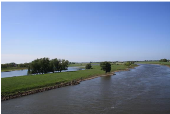
De IJssel bij Westervoort met tichelgat