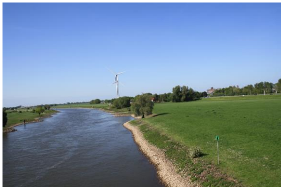
En de windmolens bij Arnhem

Rechts zie je de rest van het fort bij de brug over de IJssel, dat ten behoeve van de aanleg van de Pleyroute is gehalveerd en is meer veranderd sedert Thijssse, er is een aparte fietsbrug aangelegd. Je fietst de IJsselbrug over. Rechts zie je beneden in de uiterwaarden een oud tichelgat met veel watervogels. Een tichelgat is een waterplas, ontstaan door kleiwinning voor de fabricage van bakstenen. Afhankelijk van de tijd van het jaar zijn in deze plas o.a. kokmeeuw en zilvermeeuw, meerkoet, smient, wilde eend, tafeleend en kuifeend en wilde-, kleine- en knobbelzwaan te zien.