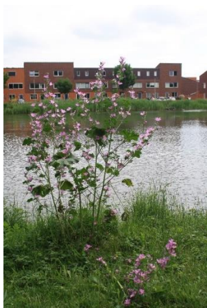
Kaasjeskruid bij de centrale vijver