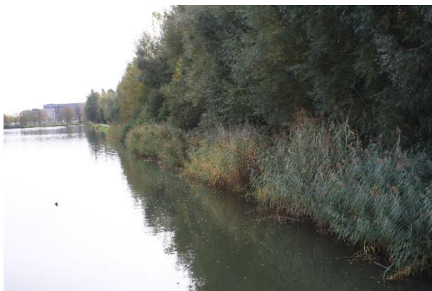
Het Centrumbos ter hoogte van de centrale vijver