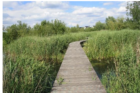
Vlonderpad door de ecozone