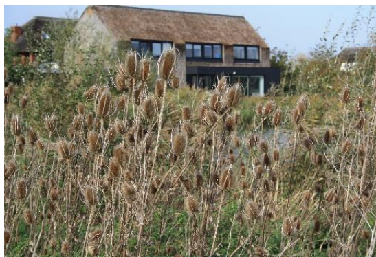
Kaardenbollen op verschillende plaatsen in Schuytgraaf