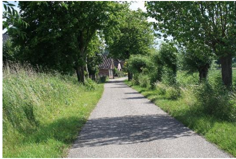
Het oude bebouwingslint van Het Vlot

Langs deze weg zie je nog een aantal heel oude knotwilgen. Ook heb je fraai uitzicht op de stuwwal aan de noordzijde van de Rijn. Het Vlot is een oud buurtschap dat al lang bestond voordat de wijk Schuytgraaf werd gebouwd. Het was in het verleden onderdeel van de gemeente Heteren. Nu ligt de grens van de gemeente Over Betuwe, waar de oude gemeente Heteren in is opgegaan, direct aan de westzijde van de sloot.