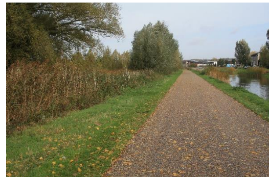
De ecologische zone links en het stedelijk watersysteem rechts van het verharde pad

Bij het ontwerp van deze zone zijn de verschillende watersystemen gescheiden om er voor te zorgen dat de ecozone haar eigen schone waterkwaliteit houdt, maar ook een natuurlijk waterpeil; hoog in de winter en lager in de zomer. De natte ecozone heeft een oppervlakte van 34,8 hectare waarvan bijna een derde uit de voormalige zandwinplas en haar omgeving bestaat. Hier is bij het begin van de aanleg van de wijk Schuytgraaf zand gewonnen om de te bebouwen delen op te hogen.