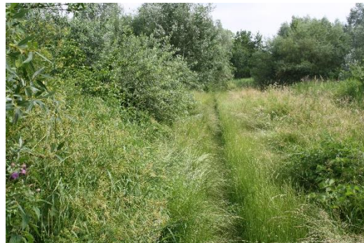
Tredpad aan het begin van de route