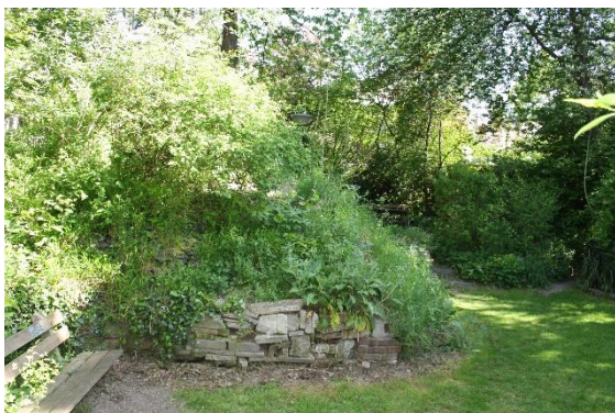
De ecologische tuin

Tot 1987 stond hier de drukkerij Haven-Weenink. Na de sloop van de drukkerij moest de verontreinigde bodem worden gesaneerd. Daarna werd de Watertuin aangelegd die in 1993 werd geopend. Het is een tuin om op je gemak te bekijken en wellicht even een rustpauze in te lassen. Er zijn verschillende plantengemeenschappen in de tuin, met veel interessante planten, waarbij ook veel waardplanten voor vlinders.