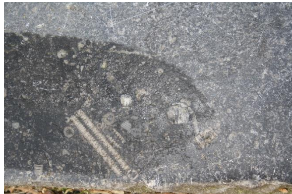
Steel van een zeelelie