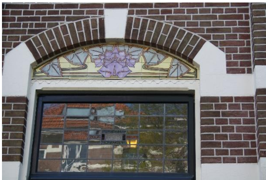
Parkstraat nr. 78/80 Jugendstil-versieringen