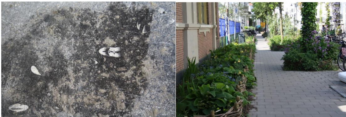
Figuur 2 een wandeling langs fossielen en groen

Veel stoepen en buitentrappen zijn gemaakt van een harde kalksteensoort die door koolstof een blauw-grijze kleur heeft. Opvallend in deze steensoort zijn de vele fossiele resten van zeedieren, zoals koralen, zeelelies, een soort schelpdieren (Brachiopoden), en mosdiertjes (Bryozoën). Deze dieren leefden tijdens het onder-Carboon, 350 tot 330 miljoen jaar geleden, in een warme zee. De zeebodem, met de resten van deze dieren, is in latere perioden versteend en omhoog gedrukt. In de omgeving van Namen komt dit gesteente aan de oppervlakte en werd daar massaal gewonnen en geëxporteerd als 'Belgische stoepsteen'. Voor het meten van de ouderdom van gesteenten wordt gebruik gemaakt van bekende halfwaardetijden van radioactieve isotopen, zoals uranium en thorium, waarvan sporen in het gesteente voorkomen. Tijdens de hierna beschreven wandeling kan je zien dat heel veel huizen stoepen van blauwe stoepsteen hebben en dat bij sommige huizen ook het onderste deel van de muren in hardsteen is uitgevoerd. Als je er oplet zal je zien dat in vrijwel elke stoep en in heel veel hardstenen muren fossielen zichtbaar zijn. De fossielen zijn vooral goed te zien als er met een vochtig doekje over de afdruk wordt gewreven. Voor mensen die geïnteresseerd zijn in de fossielen wordt daarom aanbevolen om in een plastic zakje een vochtig doekje mee te nemen. In de wandeling zal je in verschillende straten, bij een aantal huisnummers, hierop worden geattendeerd.