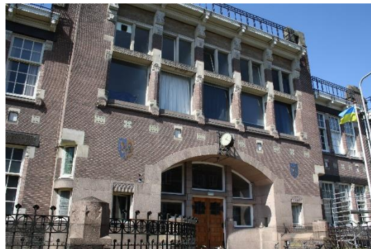
De voormalige Lorentz H.B.S.

14. Het kleine straatje links leidt naar de 'Achtertuin' , een oase van rust in de verder zo drukke buurt.